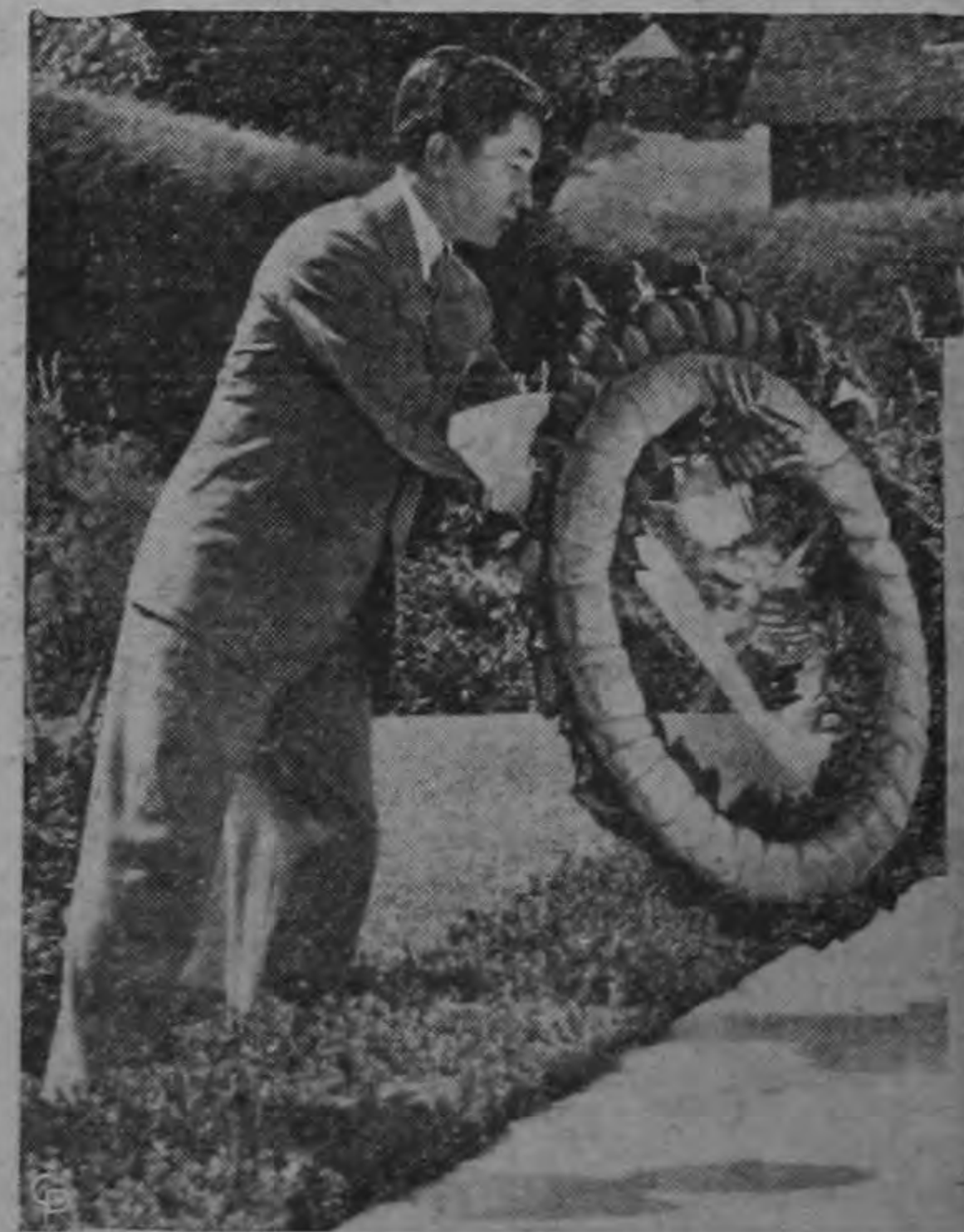
EL PRINCIPE AKIHITO, de Japón, coloca una ofrenda floral en la tumba del Presidente Franklin D. Roosevelt, en visita al hogar del ilustre fallecido en Hyde Park. (INTERNACIONAL).

Carlos Valerín & Co. — EL PALACIO DE LAS REVISTAS TEL.: 1777 — (Frente al costado Es e del Teatro Raventós — APDO. 1924