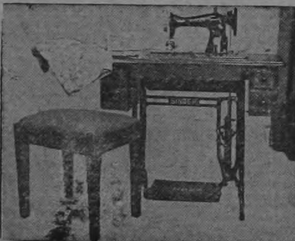
MODELO 15-88 Equipada con ojalador, cubierta y banquito.