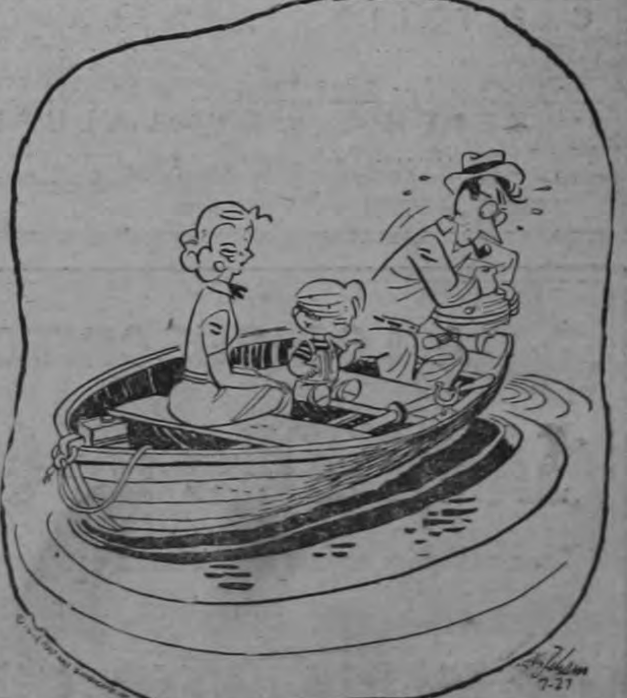
Te diré, por si no lo sabes, que cuando echa a andar hace "puuu... puuu... puuu..."