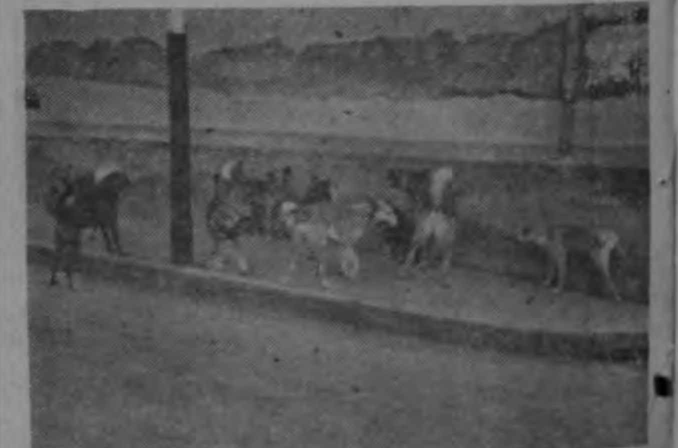
Urge la intervención de las autoridades la gran cantidad de perros sueltos que se encuentran en todas partes de la ciudad capital, con peligro en muchos casos para la seguridad de los habitantes y causa de permanente molestia entre los vecinos