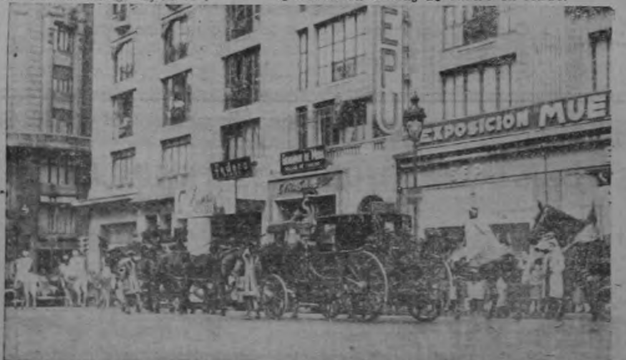
Un entierro de Estado en España, es tan fastuoso y lleno de colorido como la ceremonia de la coronación. Nóte se lo elaborado de la carroza.