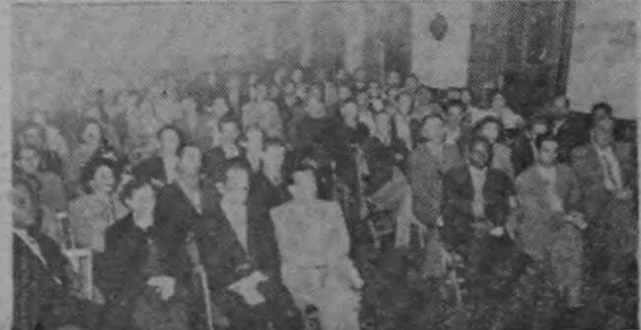
Un aspecto de la concurrencia a la Asamblea General de Juntas Progresistas de la capital, realizada en la noche del miércoles en el local del Partido Social Demócrata.

2 DE OCTUBRE DE 1953 Carácter General del tiempo en Costa Rica: El día de hoy se caracterizará por ser normal de la estación lluviosa, o sea, débilmente caluroso con una mañana nublada parcialmente y tormentas con chubascos aislados por la tarde en las tierras del interior y por la noche en las costas. En la Meseta Central los chubascos ocurrirán entre una y las cinco de la tarde. La noche será despejada.