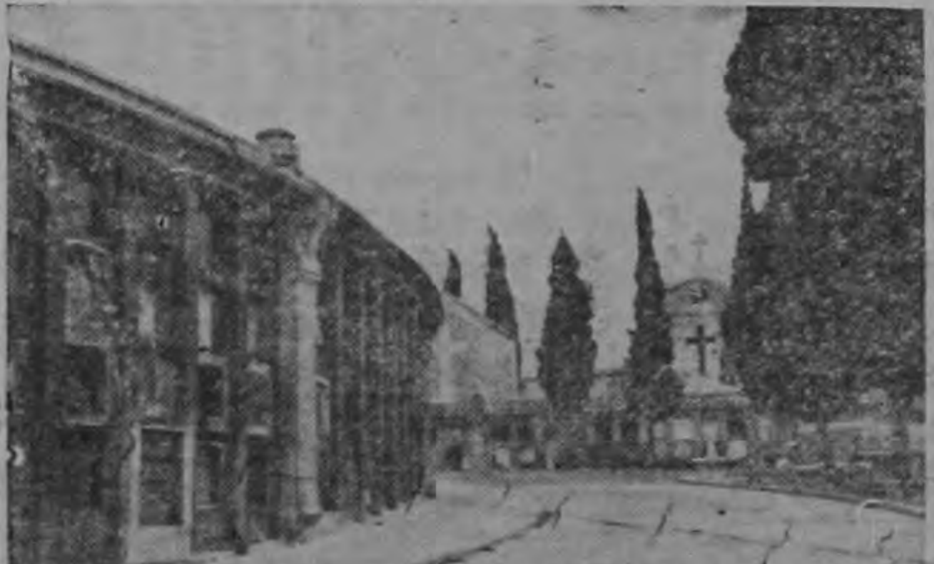
En este cementerio de España (a la izquierda) las tumbas se hallan en hileras de cuatro en fondo.

El seguro funerario en España está controlado por 100 compañías, muchas de las cuales proporcionan también servicios médicos (hay una que vende hasta aparatos). Por menos de un dólar mensual se puede asegurar a toda una familia compuesta de seis personas si se quiere un entierro de primera clase y tratamientos médicos. Tercera clase cuenta y cuesta solamente la mitad de la cuota.